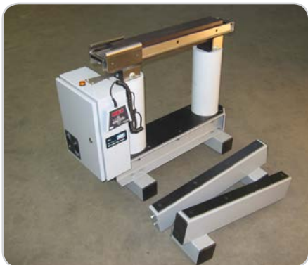
Рисунок 1: TH L в состоянии поставки