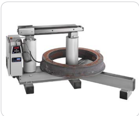
Рисунок 5: TH L с горизонтальным нагревом детали