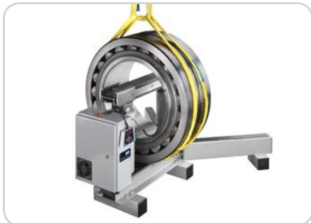
Рисунок 4: TH L с вертикальным нагревом детали