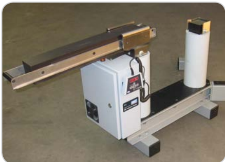
Рисунок 3: TH L с открытым затвором сердечника