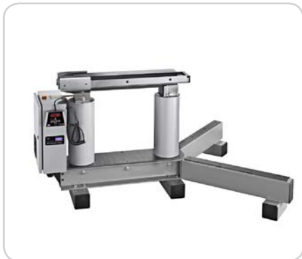
Рисунок 2: TH L после сборки опор подшипников